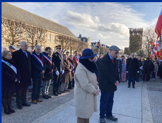
Caen le 27 janvier