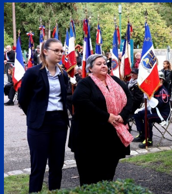
Aincourt le 4 octobre