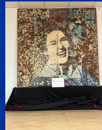
Tronget, collège Charlotte Delbo