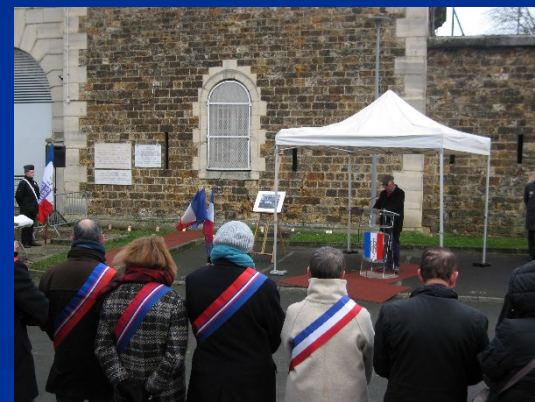
Romainville le 26 janvier