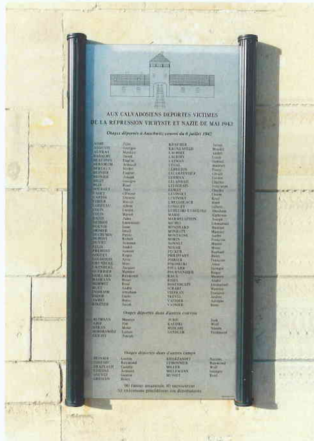
Stèle des déportés caennais et calvadosiens victimes de la répression vichyste et nazie de mai 1942 posée sur la façade de l'ancien bâtiment du Petit Lycée,

À l'occasion du triple anniversaire 81 ans de la Libération du camp d'Auschwitz-Birkenau, le 27 janvier 1945 83 ans de l'arrivée du convoi de femmes dit des «31000» dans le camp d'Auschwitz-Birkenau, le 27 janvier 1943 84 ans du déraillement de deux trains à Airan et de la politique de représailles de l'occupant