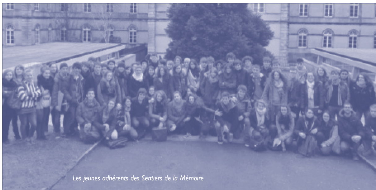
Les jeunes adhérents des Sentiers de la Mémoire

intervenants, l'animation des conférences et des débats ou l'ensemble de la logistique. C'est donc une mise en responsabilité totale des jeunes, à tel point que Fernand