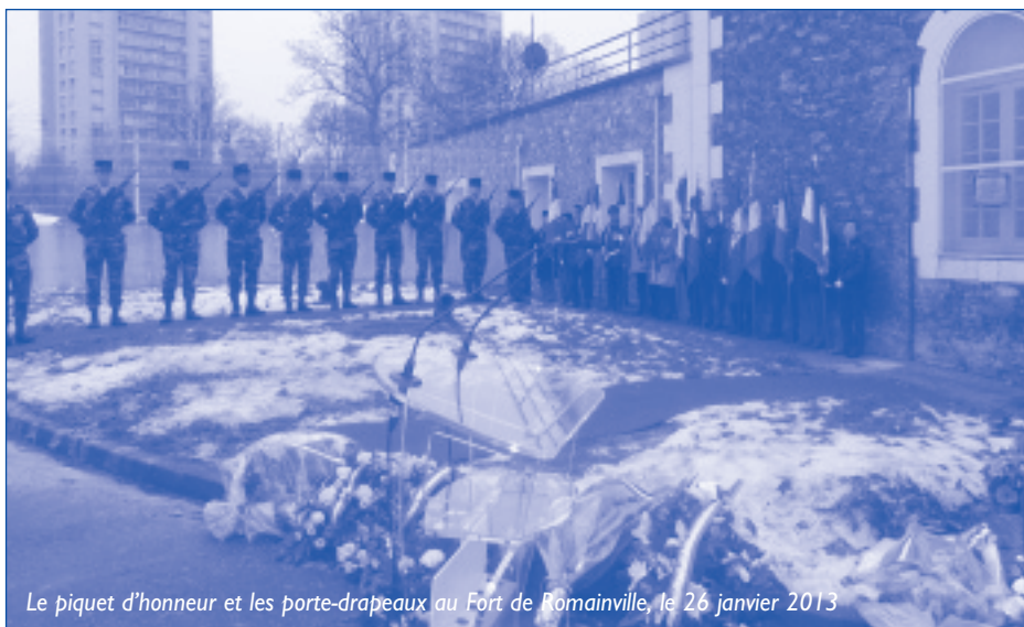
Le piquet d'honneur et les porte-drapeaux au Fort de Romainville, le 26 janvier 2013

Claude Bartolone, Président de l'Assemblée Nationale