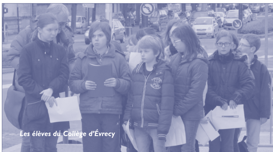
Les élèves du Collège d'Évrency

hommes et de ces femmes assassinés qui refusaient la soumission. Nous savons qu'ils ou Elles ne disparaissent vraiment que lorsque disparaît le sens de leurs actions et des idées qu'ils ou Elles ont semées. Ensemble, défendons les acquis de la Résistance, c'est la meilleure façon de leur rendre hommage.