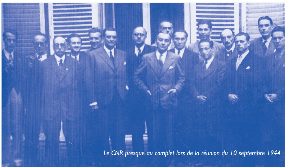
Le CNR presque au complet lors de la réunion du 10 septembre 1944

Malgré les coups portés par le patronat, son